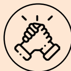
Co-développement entre pairs