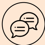
Témoignages et visites inspirantes