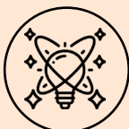
Transmissions d'éléments théoriques et d'outils